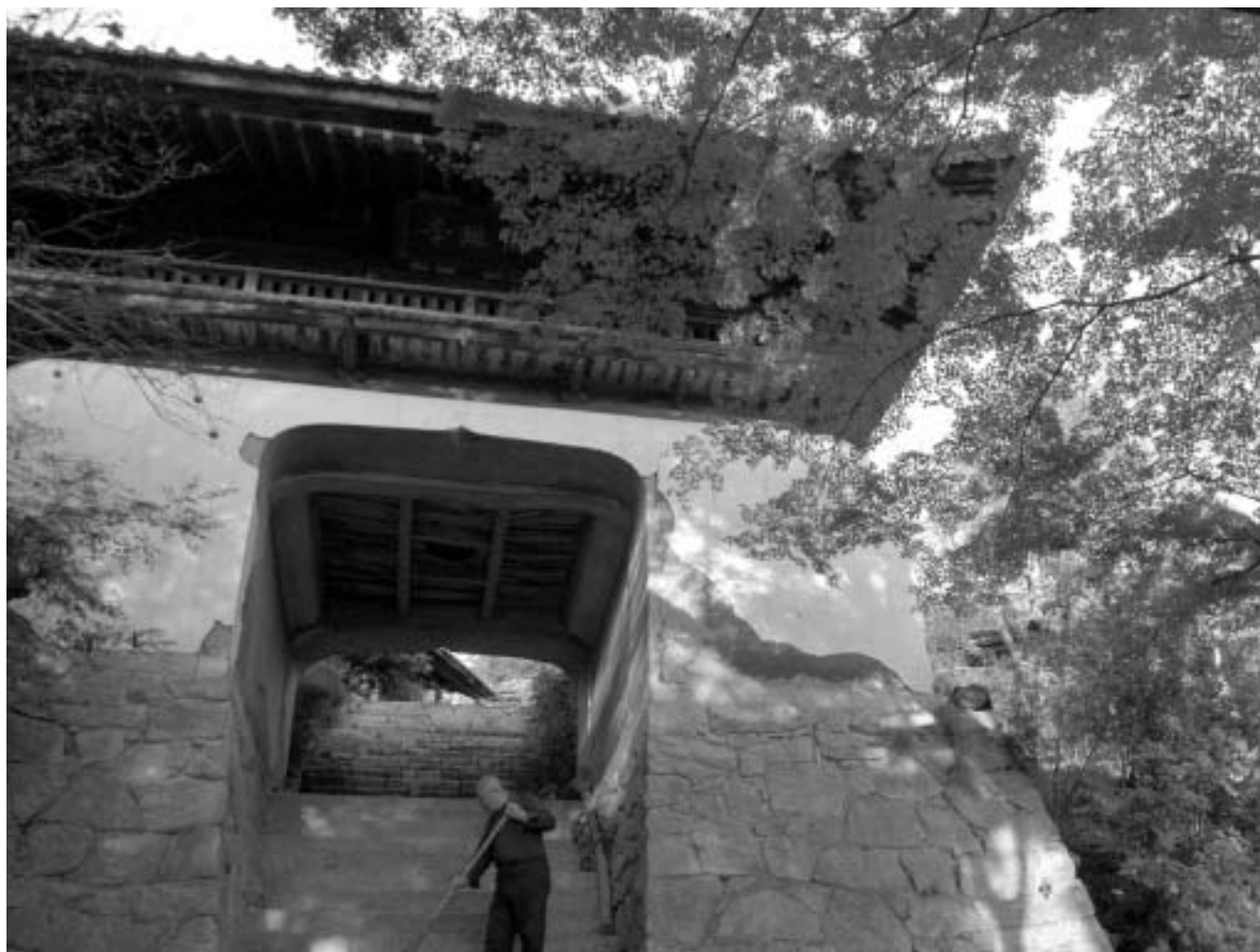
仙琳寺の楼門（古沢町）