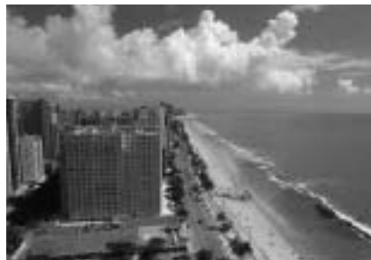
▲レシーフェの美しいビーチ

ルトガル人がブラジルを発見した最初の土地で、植民地時代の歴史を物語る美しいまちなみが広がっています。また、同じく中心都市のレシーフェのビーチには、世界中からたくさんの方がヴァカンスに訪れます。