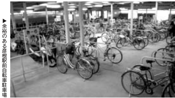
▶ 余裕のある彦根駅前自転車駐車場