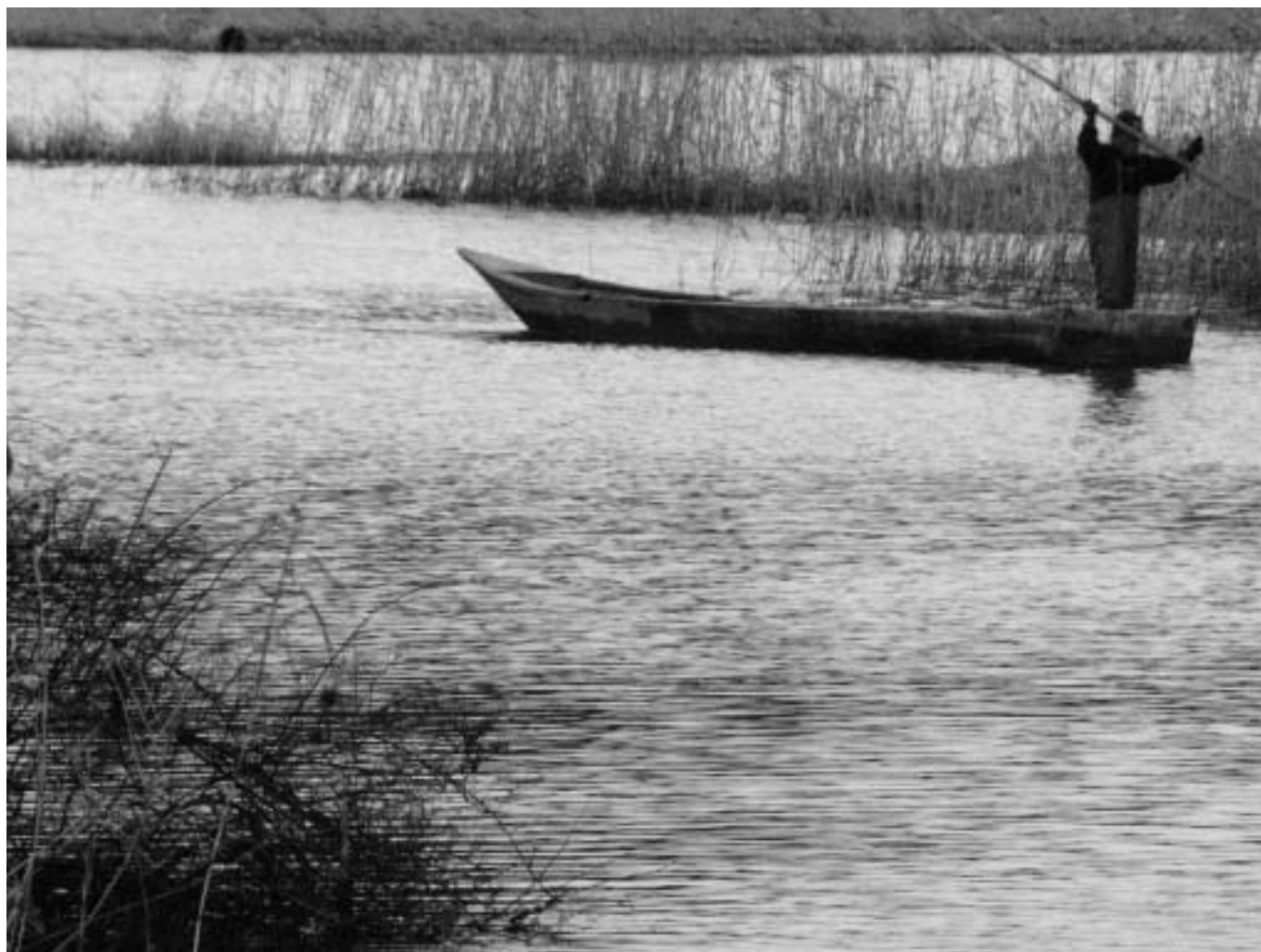
田舟で行う曾根沼の漁