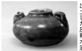
古屋敷遺跡から出土した灰釉水甕

たのでしょうか。室町時代から戦国時代に、宇曾川のほとりにあった集落の跡、古屋敷遺跡について、出土品を中心に図、写真、解説を交えて展示します。 問い合わせ先 圏教育委員会文化財課☎26-5833、FAX26-5899