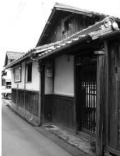
▶旧彦根藩足軽組屋敷(善利組・太田家住宅)

募集人数 30人 応募資格 高校生を除く16歳以上で発掘について専門知識のある人・経験者・関心のある人 登録期間 4月13日(水)~9月30日(金) この期間で、必要に応じて雇用します。 面接日時 4月7日(木) 9:30集合 受付場所 市民会館(尾末町) 申込・問い合わせ先 4月6日(水)17:15まで(土・日曜日、祝日を除く)に 教育委員会文化財課 ☎26-5833、FAX26-5899へ。 ※必ず事前に申し込んでください。