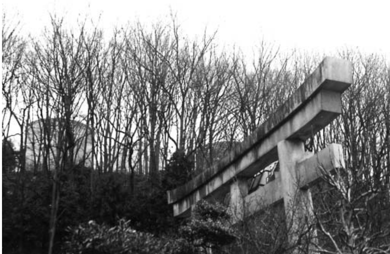
木々の間に天王山配水池が見える冬の雨壺山の風景 あまつぼやま