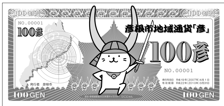
地域通貨は、カラーで印刷され、大きさは横15cm、縦7cmです。

「広報ひこね」7月15日号や彦根市ホームページなどで募集した、彦根市地域通貨「彦」のデザインが決まりました。市内から203点、県内他市町から8点、県外から10点の、合計221点の応募があり、彦根市地域通貨「彦」デザイン選考委員会で選考した結果、上のデザインが選ばれました。今後、このデザインをもとに、偽造防止などを施し、来年4月から「美しい行為」に対してお渡しする地域通貨として発行します。皆さんも活動に参加して、「彦」を手に入れてください。