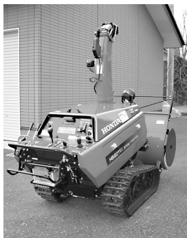
上稲葉町自治会の除雪機

宝くじの助成金で 除雪機、御輿を 整備しました 宝くじ助成とは、地域コミュニ ティーの健全な発展を図るこ とを目的として、(財)自治総合セ ンターが宝くじの収益を財源に 実施しているものです。 平成18年度は、この宝くじ助 成により、上稲葉町自治会が除 雪機を整備し、葛籠町自治会が 御輿を整備しました。 問い合わせ先 ☎まちづくり 推進室 ☎3016117番、F A X 221398番