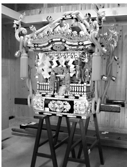
葛籠町自治会の御輿