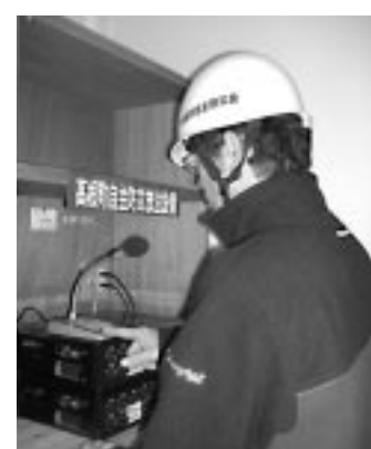
▲高根町自治会の放送設備

宝くじ助成金は、地域コミュニティの健全な発展を図ることを目的として、自治総合センターが宝くじの収益金を財源に実施しているものです。 平成18年度は、高根町自治会(鳥居本町)が、この制度を利用して、屋外放送設備を整備されました。