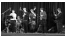
▲平成17年に来彦したアナーバー高校生ジャズバンド

日程 11月16日(金) 18:30~ ひこね市文化プラザ 同17日(出) 13:30~ ひこね市文化プラザ 同18日(日) 13:30~ 聖泉大学 体育館