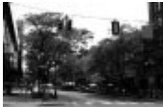
▲アナーバー市の町並み

彦根市と彦根市国際協会では、築城400年祭の開催を記念して、今年さまざまな国際交流イベントを開催します。世界各地の音楽や芸術をお楽しみください。