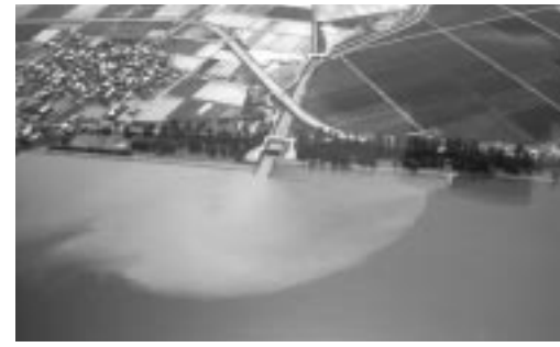
平成18年5月の文禄川河口付近(石寺町)

農業濁水を流さないで 田植え前の強制落水は絶対にやめましょう 園農林水産課 3016118番 FAX2419676番 代かきや田植えの時期が近づいてきました。農家の皆さんには忙しい時期です。 この時期、農作業による濁水が流出すると、びわ湖の水質を悪化させ、魚など、生き物が住みにくくなります。「環境こだわり農業」を目指して、近江米生産者としての自覚を持ち、濁水を流さない農業を実践しましょう。 けい畔の点検、あせ塗り、またはあせシートを設置しましょう。 代かきは浅水で行い、濁水を流さないようにしましょう。