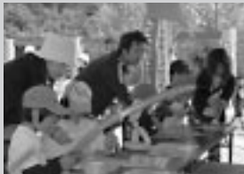
▲昨年も多くの人でにぎわいました。

体験コーナーや楽しい遊びなど、アイデアあふれる内容が満載です。子どもたちを対象とした、ふれあい遊びを開催します。楽しい一日を過ごしてください。