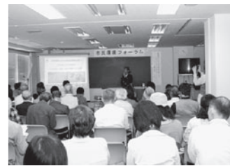
◀ 昨年の市民環境フォーラム

〈内容〉今年度の市民環境フォーラムは、「ごみ減量対策を考えるー各地のごみ事情から学ぶー」をテーマとして、開催します。このフォーラムで、他府県や他市のごみ事情について発表していただける市民を募集します。〈日時〉10月20日(出)10:00~12:00 〈場所〉大学サテライト・プラザ彦根(アル・プラザ彦根6階) 〈人数〉3人程度 〈募集期間〉9月18日(火)~10月12日(金) 応募者多数の場合は、地域性などを考慮のうえ決定します。〈応募方法・問い合わせ先〉園生活環境課 ☎30-6116、FAX27-0395へ