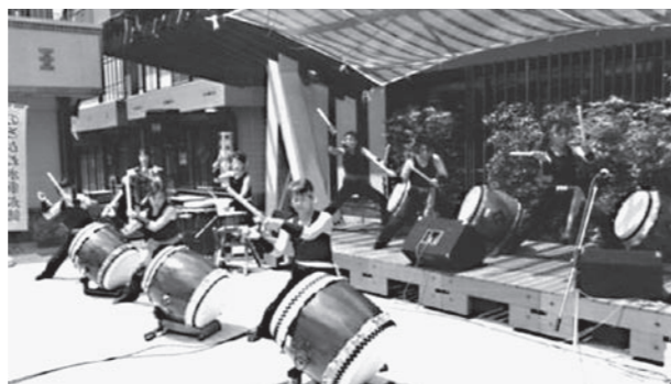
▲オープニングを飾る「のどがわ水軍太鼓」

日時 9月29日(土) 午前11時～午後8時 9月30日(日) 午前10時～午後3時 場所 男女共同参画センター「ワイズ」 内容 ワークショップ、1日体験、バザー、展示、模擬店など 参加費用 無料(ただし、模擬店など一部実費が必要です) 問い合わせ先 男女共同参画センター「ワイズ」 ☎243529 (FAX 共用)