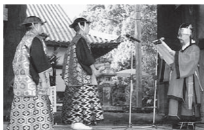
▲対馬で行われた国書の交換式の様子

四番町スクエアにテントを設置し、彦根と韓国の観光や物産を紹介します。 日時 10月6日(土)～10月8日(月) 午前10時～午後7時