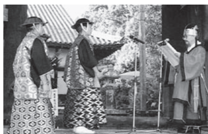
▲対馬で行われた国書の交換式の様子

四番町スクエアにテントを設置し、彦根と韓国の観光や物産を紹介します。 日時 10月6日(土)～10月8日(月) 午前10時～午後7時