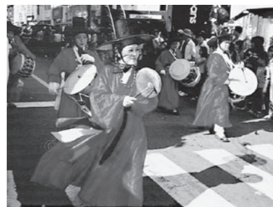
▲韓国・釜山で行われた朝鮮通信使の行列

歴史的にゆかりのある朝鮮人街道を中心に、当時の朝鮮通信使の行列を再現します。 日時 10月8日(月) 午後1時～午後2時30分 行列順路 芹橋～彦根城域～宗安寺