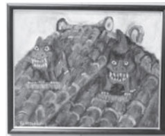
▲滋賀県芸術文化祭奨励賞を受賞した洋画部門の「シーサー」

一般出品451点の中から、市展覧6点、特選26点、佳作14点、入選276点を選ばれました。また、過去3年間連続特選受賞などにより、無鑑査となった人の作品から、5点が奨励賞に