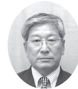
稲枝中学校長、東中学校長を歴任、57歳