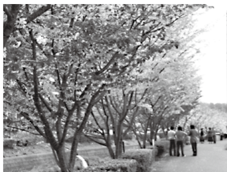
▲毎年4月中旬ごろに満開となる 平田川沿いの桜並木

美しいひこね創造事業では、 私たちのようなボランティア活 動に対して、「彦」が交付され ます。「彦」は、会の活動経費 として活用できるため、とても