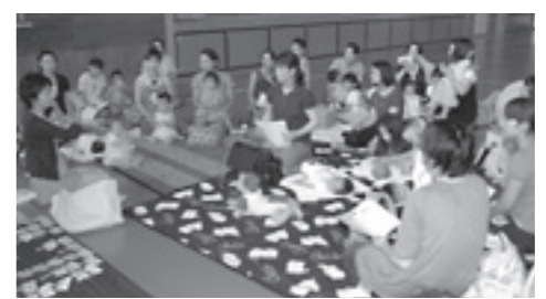
▲わくわくおっぱい塾、8月は歯科衛生士さんが、母乳と虫歯についてお話ししました。

「広報ひこね」8月1・15日号18ページの「メタボリックシンドロームをやっつけろ！」において、特定健康診査・特定保健指導の対象が、「40歳から70歳以下」とあるのは、「40歳から74歳以下」の誤りでした。おわびして訂正します。