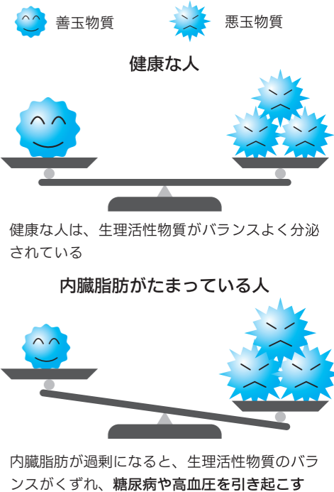
図2 生理活性物質とバランス

特定健康診査であなたのからだをチェック! 40歳から74歳の人が対象となる特定健康診査では、B M なお、特定健康診査を受診するときには、加入している医療保険者が発行する受診券と健康保険証が必要です。ご注意ください。 お問い合わせ先 困健康管理課 ☎24-0816番、FAX 24-5870番、困保険年金課 ☎30-6112番、FAX 21-2220番