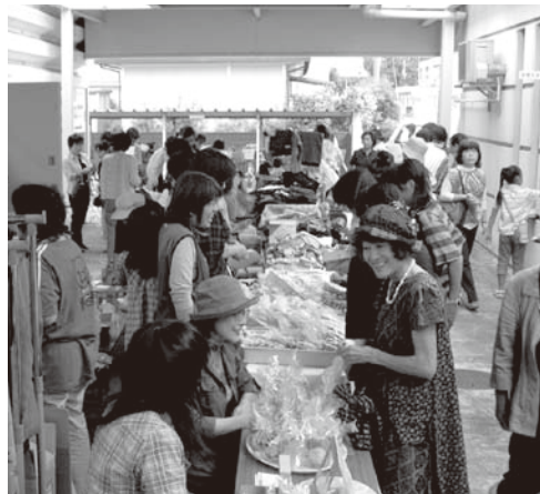
▲昨年度のウィズフェスティバルで行われたフリーマーケット

乳幼児を対象とした室内遊園地での遊びや、カレーライスを販売するバザー、一日体験、展示、フリーマーケット