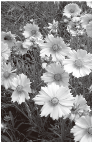
▲オオキンケイギク