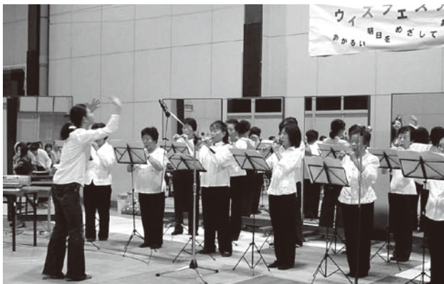
▲昨年度のウィズフェスティバルでよし笛を演奏する団体

彦根市男女共同参画センター「ウィズ」の開館5周年を記念して、「ウィズ」の登録団体が主体となった、ウィズフェスティバルを開催します。 このイベントは、男女共同参画を広く推進する登録団体が、日ごろの活動報告などを行い、参加者の人たちのふれあ