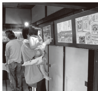
▲7月に行われた足軽屋敷と上田道三絵画展