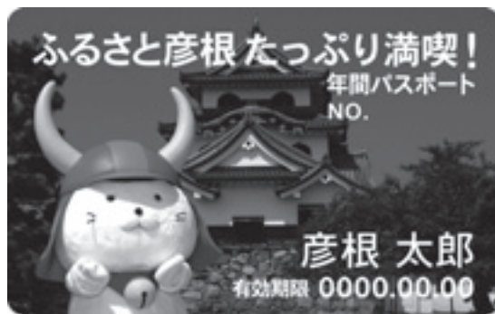
▲寄附のお礼として贈られる年間パスポート

彦根市では、現在、寄附金の協力をお願いしています。10月10日までに、22人から合計で46万5,000円の寄附をいただきました。 引き続き、彦根らしい魅力あるまちづくりを実現していくため、より多くの人に寄附を呼びかけていきます。 市民の皆さんも、同窓会など、市外に住んでいる友人や知り合いの人が集まる機会に、寄附の呼びかけにご協力をよろしくお願ひします。