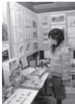
▶ 防災用品などが展示される防災展

開催場所 市役所1階ロビー 展示内容 災害などの写真、パネル展示、防災用品の展示 など