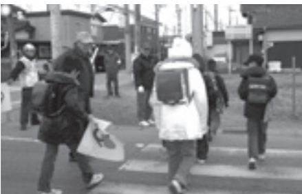
▲交差点であいさつ運動するクラブの人たち

私たちニコちゃんクラブは、西肥田町民のコミュニケーションをよくして、できる人が、できるときに、できることを楽しみながら実行することで、「元気な明るい町づくり」をお手伝いしようとするグループです。名前の由来は、ニシヒダの「ニコ」とコミュニケーションの「コ」で愛称ニコちゃんです。 活動の一つを紹介します。毎月8日と25日の月2回、午前7時30分から8時までの30分間、スクールガード活動の一環として西肥田交差点で、登校する小学生にあいさつ運動をしています。当初は、ほとんどあいさつが返ってこなかったのですが、最近では返事が返ってくるようになってきました。笑顔で返事が返ってくると本当にうれしいものです。 このほかにも、県や市が実施しているエコフォスター制度にも参加しています。毎月1回、宇曾川の堤防をウォーキングしながら、空き缶などのゴミを拾っています。 これらの活動もメンバーだからと言って、毎回参加しないといけないわけではありません。できる範囲でかまわないので、気楽な気持ちで参加してほしいと思います。そして、この活動の輪がもっと広がってほしいと思っています。