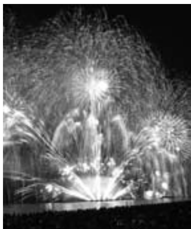
▶ 昨年の彦根大花火大会