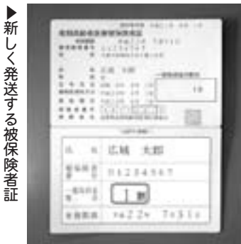
新しく発送する被保険者証