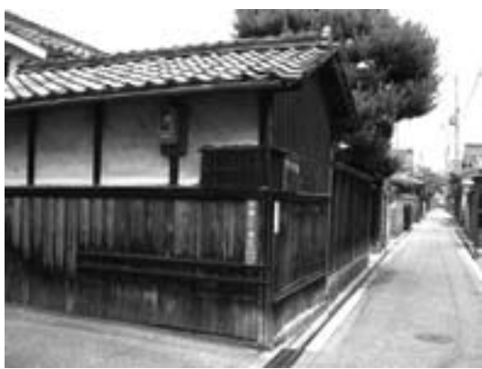
▶辻番所と江戸時代以来の狭い通り

これら足軽組の中で、もっとも規模の大きかったのが善利組でした。現在の芦橋一丁目・二丁目一帯に相応します。東西約750m、南北約300mを占め、幕末期には約700戸を数えました。現在、江戸時代の建物は1割に満たないまでに減少していますが、間口5間(約9m)、奥行10間(約18m)ほどの短冊形の敷地に、木戸門と目板瓦葺の塀に囲まれた小さいけれども、武家屋敷の体裁を整えた建物を確認することができます。