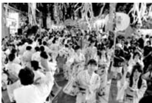
▶ 昨年の彦根ばやし総おどり大会