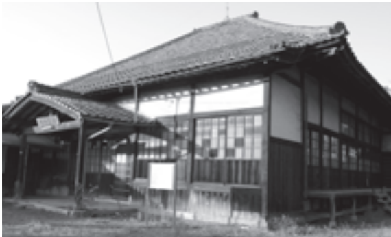
▲現在の弘道館の建物

金亀会館は、藩校弘道館の講堂を大正12年に中央町の現在地に移築した建物です。講堂は、中央に「本堂」、周囲に「庇」、さらに前後には「孫庇」を設け、正面中央に切妻屋根の玄関を付けています。後ろの孫庇の中央は1段高くして「仏間」に利用されています。器などが置かれる空間ではなく、講堂を用いて、多くの教授