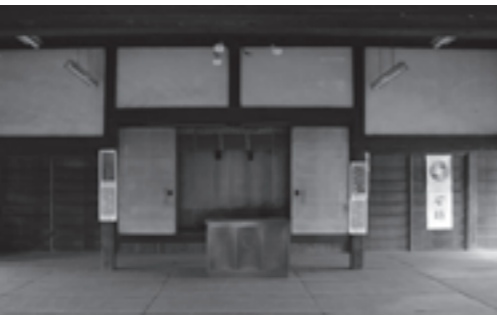
▲現在の弘道館の建物内部

陣がさまざまな講義をしたこととでしょう。弘道館には、講堂のほかにも剣術・槍術・弓術・馬術などを習う施設や、諸学を学ぶ学寮が建っており、敷地面積はおよそ6,000㎡ほどあります。金亀会館は、現在、建物調査を実施していますが、今後、保存のための修理を行い、修理の完成の後には、藩校の姿を留める唯一の建物として、