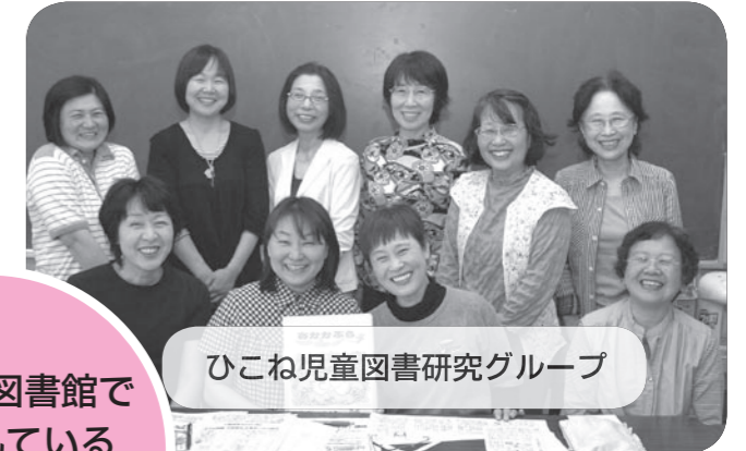
ひこね児童図書研究グループ