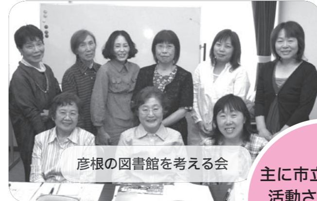
彦根の図書館を考える会

そのために、活字だけの本を読むのは苦手、という子どもが多くなってきたようです。 しかし、子どもは、おはなしを聞いて楽しむ力を、もともと持っています。 本を読んでもらって、中に書かれていることが面白いので、もっと知りたい、という経験をすれば、子どもは自然と本を読もうとします。 子どもに読む力がつくまで、まわりの大人が、「思いのこもった生の声」で本を読んであげてほしいと思います。 子どもが本を好きになるためには、本を読んであげるのが一番の近道になるでしょう。子どもとふれあえる、とても素敵な時間を過ごさせます。 子どもの本についての相談や、学校での「朝の読書」などの集団への読み聞かせに関するアドバイスもしています。 お気軽にお尋ねください。