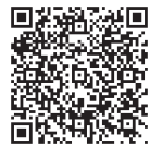
▲パパママ学級の申し込みQRコード

これからの出産や育児について、もうすぐパパやママになる人といっしょに学んでみませんか。 内容 赤ちゃんのお世話 (お風呂、おむつ交換、だっこの仕方)、妊婦体験 など 日時 8月14日(土) 10:00~12:00 (受付は9:45~10:00) 場所 福祉保健センター 2階 対象 市内に住民登録のある妊娠28週以降の夫婦 (夫婦での参加とします) 定員 18組 (申込多数の場合は、予定日が近い人を優先します) 持ち物 母子健康手帳・父子健康手帳 申込期間 7月15日(木)~同23日(金) 申込方法 健康推進課まで申し込んでください。QRコード対応の携帯電話を使って申し込むこともできます。