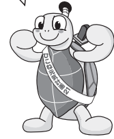
ひこね元気計画21 マスコットキャラクター “コンキー君”