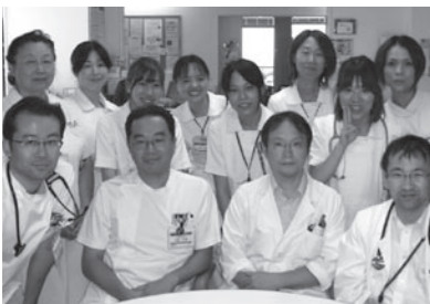
▲呼吸器科スタッフ

県下の呼吸器科医師不足のため、近隣の医療圏からの紹介患者が増えていきます。湖東地域の中核病院としての役割を果たすように、病診連携を図りながら、呼吸器診療の充実に努めていきます。