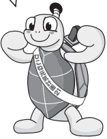
ひこね元気計画21 マスコットキャラクター “コンキー君”