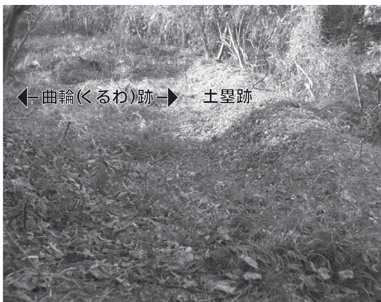
← 曲輪(くるわ)跡 → 土塁跡

問い合わせ先 県教育委員会文化財課 ☎ 26-5833番、FAX 26-5899番、Eメール: bunkazai@mx.hikone.ed.jp