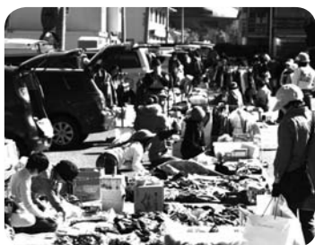
▲昨年のエコマーケット「夢畑」の様子(会場は清掃センター付近)

〈日時〉10月6日(日) 午前10時～午後3時 〈場所〉ひこね燦ばれす(小泉町) ※「チャレンジ THE ごみダイエツ