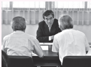
▲7月に行った巡回市長室の様子

※市内の自治会や市民活動団体なども対象とします。団体の場合は、代表者2人以上との面談とします。※政治、宗教、営利を目的