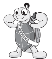
ひこね元気計画21 マスコットキャラクター “コンキー君”

☎健康推進課(平田町・福祉保健センター) ☎24-0816、FAX24-5870