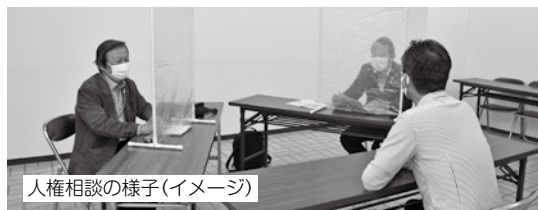
人権相談の様子(イメージ)

市では、現在11人の人権擁護委員が、人権相談などの活動をしています。毎日の生活の中で「これは人権問題ではないだろうか?」と感じたり、「法律上どうなるのだろうか?」と思い悩んだりすることがあったら、お気軽にご相談ください。