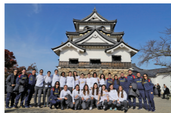
▲彦根城天守前で撮影(2019年11月)