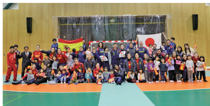
▲彦根総合高等学校でのお出迎いの様子(2019年11月)

今年7月16日(金)～同22日(木・祝)には、東京2020オリンピックのための事前合宿を市内で行う予定です。