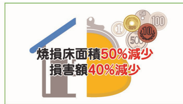
※平成29年から令和元年の火災報告から集計

「てんぷらを揚げているのに、火を消さずその場を離れてしまった…」 「タバコの火が座布団に落ちたのに、気づかなかった…」 「家族全員が寝ている夜中、放火された…」