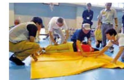
▶避難所開設運営訓練