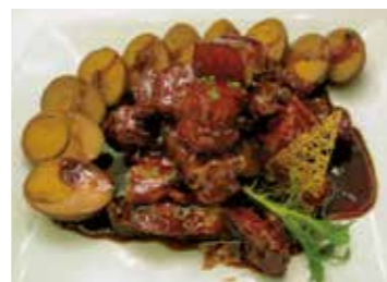
紅焼肉 (日本の角煮に似ています)