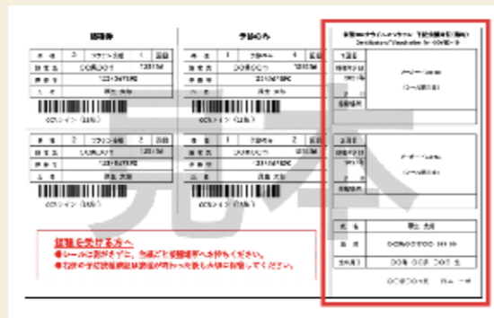
接種済証は接種後も大切に保管してください。

なお、海外渡航や日本への入国・帰国時の防疫措置の緩和等に必要とされる証明書（ワクチンパスポート）を希望する場合は、別途申請が必要です。