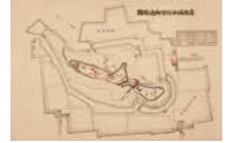
彦根城山行路御通図

本展では、彦根城の天守が一般に公開されるなど、城が人びとの親しみ場へと転換していく姿を紹介いたします。