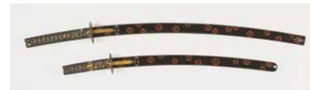
▲黒漆塗胡桃塗込鞘大小拵

【ひこね市文化プラザ・みずほ文化センターでは、次の感染症対策を実施しています】▶館内設備の定期消毒 ▶手指消毒液の設置 ▶飛沫飛散防止カーテンの設置 ▶非接触型体温計の常備 ▶新型コロナウイルス感染拡大防止システム「もしサポ滋賀」の表示の設置