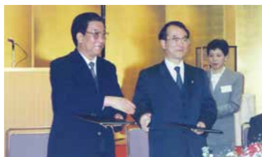
友好都市締結調印式

以来、両市の友好使節団や中学生友好交流団の相互派遣、湘潭市からの研修生の受け入れなどの交流事業を行い、友好関係を築いてきました。