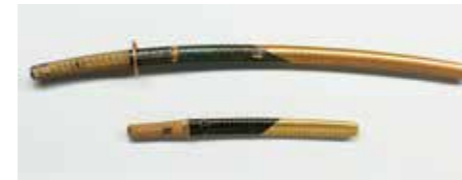
重要文化財青漆塗 金銀斗刻鞘大小拵 (京都国立博物館蔵)

鞘や柄、鐔などからなる刀装。本展では、館内外の優品を通して鞘塗を中心とした装飾の変遷を紹介いたします。