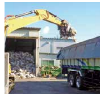
▲可燃ごみをコンテナ車に積み込む様子