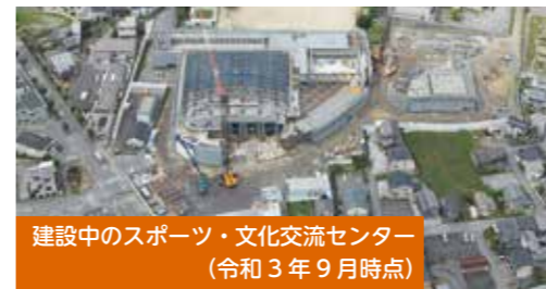
建設中のスポーツ・文化交流センター (令和3年9月時点)

スポーツと文化がつながる新しい市民の交流施設として、引き続き、彦根市スポーツ・文化交流センターの整備を行いました。