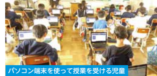
パソコン端末を使って授業を受ける児童

小・中学校において、高速大容量の通信に対応できる校内LAN（通信ネットワーク）の整備を行ったほか、教職員の負担軽減を図るため、校務支援システムの導入などを行いました。