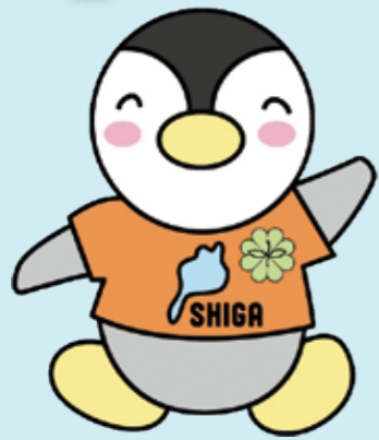
▲滋賀県民生委員・児童委員キャラクター「びわっ湖ミンジー」