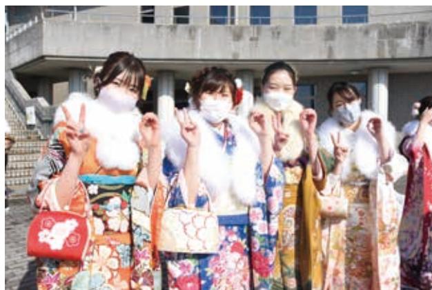
▲鮮やかな振袖姿が印象的！