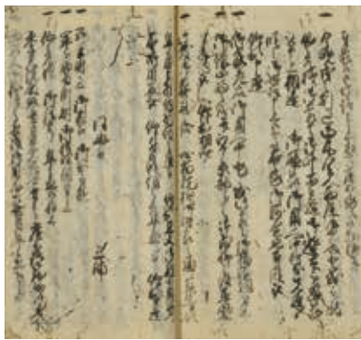
▲側役日記(彦根藩井伊家文書)【部分】

8日と15日 がともに、 藩士の「惣 出仕」(全 員出勤)の 日で、殿様 が「御目見」 を受ける日 であること から、「例 刻」が「五 つ半時」の