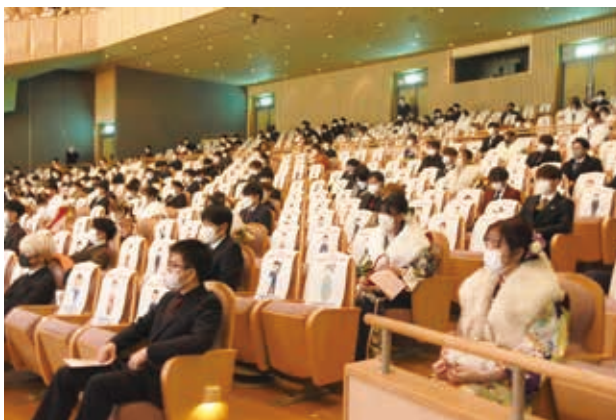
▲密を避けるため、座席を3席ずつ空けて開催しました

新成人からは、「私はコロナで卒業式を経験することができませんでした。でも今日は、小・中学校の友達にも会えて、こんな良い機会をもらえてうれしかったです。」「これから挑戦したいことは、会計士の資格を取ることです！」など、笑顔で前向きな言葉を聞くことができました。