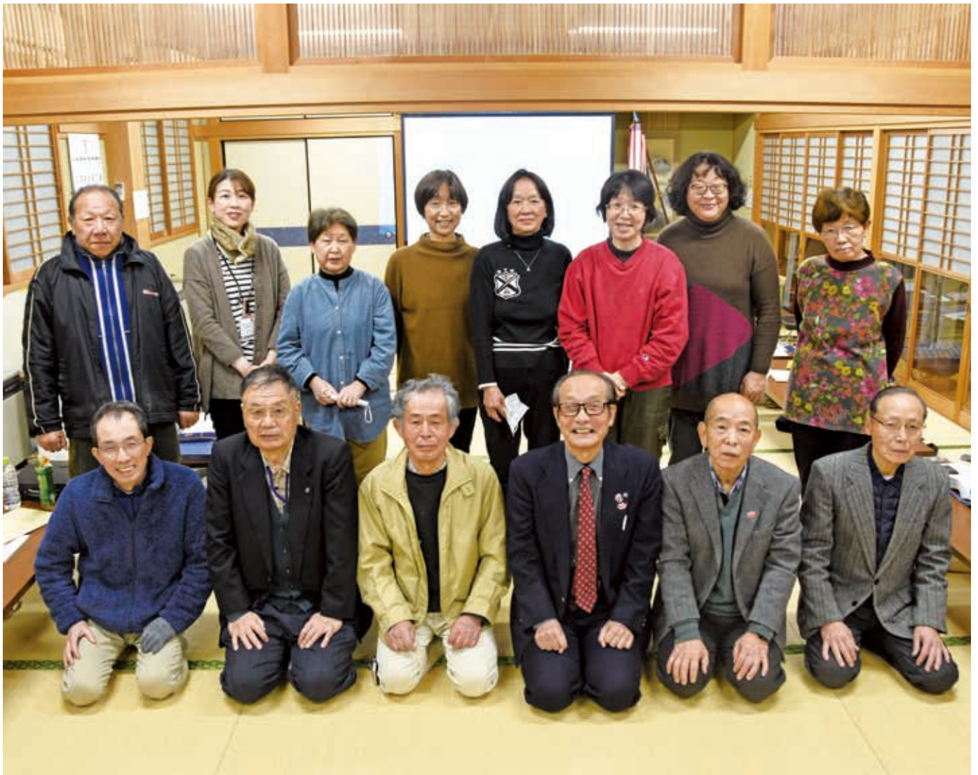
▲城南民生委員・児童委員協議会の皆さん（写真撮影のためにマスクを外していただいています）