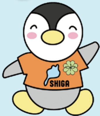
▲滋賀県民生委員・児童委員キャラクター「びわっ湖ミンジー」