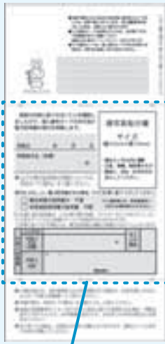
マイナンバーカード申請書