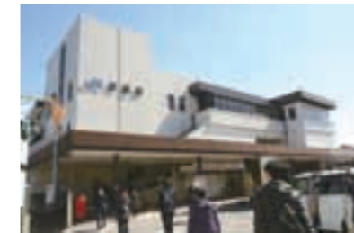
◀乗降客数が多いJR彦根駅西口