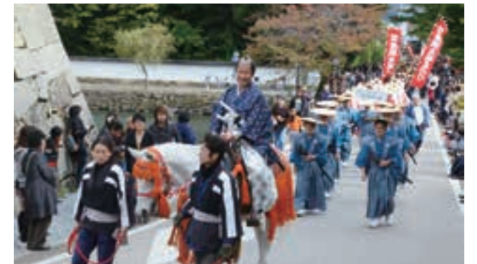
▲小江戸彦根の城まつりパレード(平成26年)

井伊直弼公生誕200年祭の開催に併せ、知名度の高い人を招くなど城まつりパレードを充実させます。