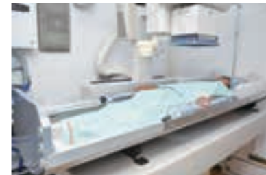
◀胃がん検診の様子

自己負担の一律ワンコイン(500円)を継続するとともに、新たに、大腸がん検診の医療機関委託を開始し、受診機会を拡充します。