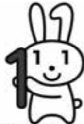
▲マイナンバー広報用キャラクターマイナちゃん

住民の利便性向上と行政事務の効率化等を目的とした社会保障・税番号制度の導入に向けた経費