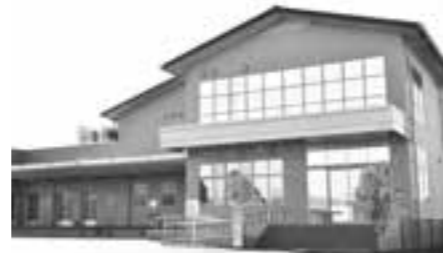
▲彦根市学校給食センター