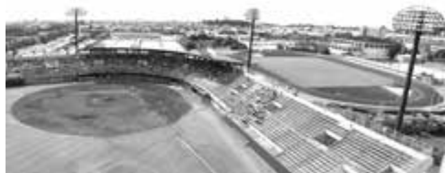
▲県立彦根総合運動場