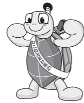
ひこね元気計画21 マスコットキャラクター “コンキー君”