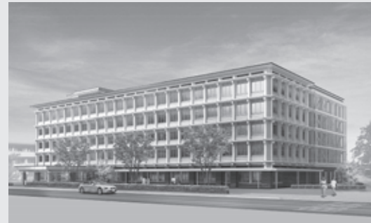
▲完成予想図。新庁舎は平成31年3月末完成予定

現在の本庁舎での業務は、8月中旬からアル・プラザ彦根(大東町)3・4階に移転します。