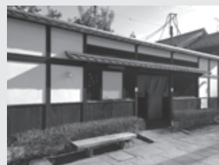
▲夢京橋キャスルロードの公衆便所

歴史探訪などを目的に中山道を訪れる人の増加に対応するため、高宮町に公衆便所を新設します。また、夢京橋キャスルロードにある公衆便所を洋式にします。