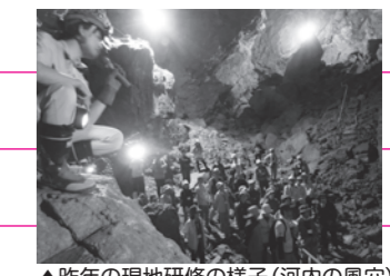
▲昨年の現地研修の様子(河内の風穴)

確かめる 実験・実習講座(4回) 9:30～11:30 ▶実験・実習やフィールドワークを中心に進めます。