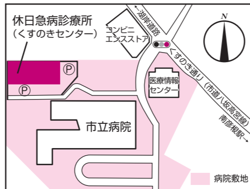
▲休日急病診療所位置図

診療日 4月29日(水・祝)、5月3日(日・祝)、同4日(月・祝)、 同5日(火・祝)、同6日(水・振) ※上記以外に、毎週日曜日、祝日および年末年始(12月29日～ 1月3日)に診療しています。 診療時間 10:00～19:00(受付は18:30まで) 診療場所 くすのきセンター1階(八坂町 市立病院敷地内) 診療科目 内科・小児科