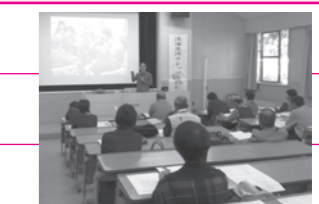
▲昨年の講義の様子(県立大学)