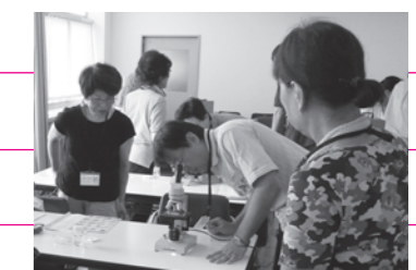
▲昨年の実験の様子(小生物の観察)