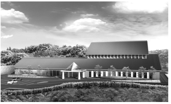
紫雲苑の完成予想図