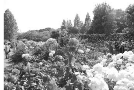
▲色とりどりのバラが咲きます(昨年の写真)

5月6日(金) (消印有効) 〈その他〉手袋、剪定ばさみなどの用具類は、各自で用意してください。 〈申込・問い合わせ先〉 市計画課(〒522-8501 元町4-2) ☎30・6124番 FAX24・8517番、庄堺公園管理事務所 ☎27・7111番 ※はがきに①氏名②住所③年齢④電話番号を書いて郵送してください。応募者には、郵送で結果をお知らせします。