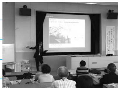
▲滋賀県立大学での講義 (昨年)

※「ひこね生涯カレッジ」は、昨年まで「淡海生涯カレッジ彦根校」として実施したものです。