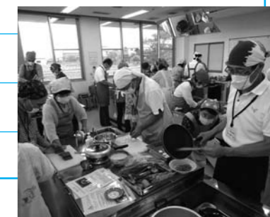
▲調理実習の様子 (昨年)

確 実験・実習講座 (4回) 9:30~11:30 ▶囲碁を体験し、その歴史やまつわる文化、健康面での効果などを学びます。