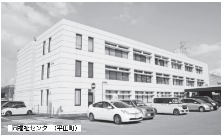
福祉センター(平田町)