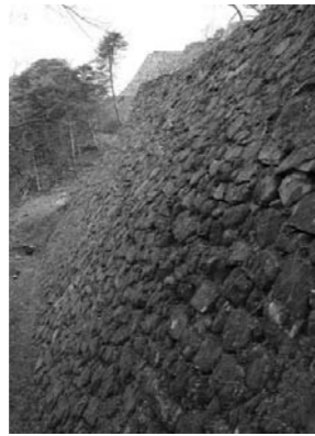
▲彦根城で一番高い石垣 (本丸直下東側)

対象 自治会、老人会、子ども会、学校、グループなど 場所 市内のご希望の場所に出張します。