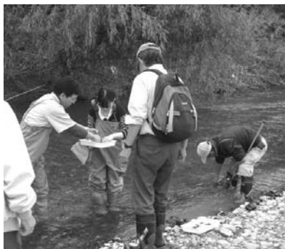
▶ 昨年の水生生物の観察

＜内容＞ 私たちの周りにある身近な水に関する環境問題について、一緒に考えてみませんか。水に関する環境を見つめ直し、さまざまな角度から学べる講座です。 ＜日程＞ 下表のとおり ＜対象＞ 市内に在住の人 ＜定員＞ 20人(先着順) ＜費用＞ 無料。ただし、8月9日(土)のフィールドワークの昼食代は、自己負担となります。 ＜申込開始日＞ 5月1日(木) ＜その他＞ 全ての講座に出席した人に、彦根市環境保全指導員資格をお渡しします。 ＜申込・問い合わせ先＞ 彦根市環境保全指導員連絡会議事務局(園生活環境課内) ☎30・6116番、FAX27・0395番