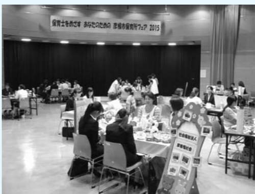
▲昨年行われた保育士フェア

日時 5月21日(土) 13:00~16:00 場所 ビバシティ彦根2階ビバシティホール(竹ヶ鼻町) 費用 無料 申込 不要 問い合わせ先 園幼児課 ☎23-9597、FAX26-1768