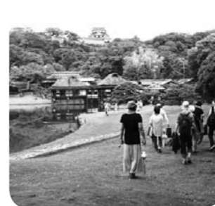
▲玄宮園での現地学習