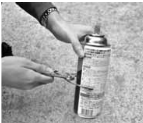
▶内容物ができるだけ使い切ってください。内容物が残っている状態で勢いよくガスが出る場合があります。