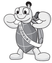
ひこね元気計画21 マスクットキャラクター “コンキー君”