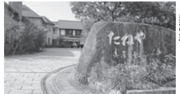
▲大賞を受賞した作品「たねや美濠の舎」